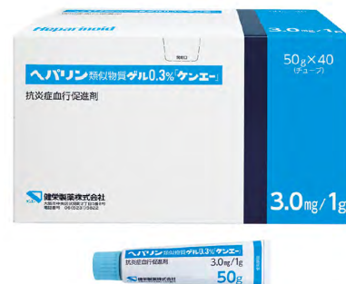
ヘパリン類似物質ゲル 0.3%「ケンエー」