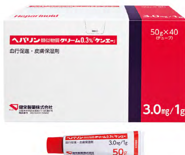
ヘパリン類似物質クリーム 0.3%「ケンエー」