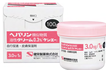
ヘパリン類似物質油性クリーム0.3%「ケンエー」