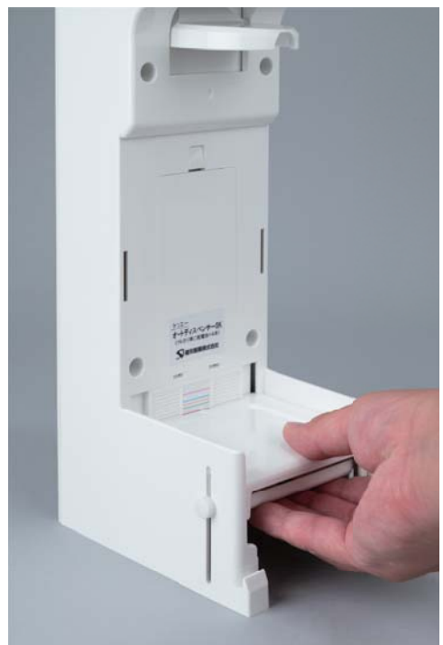
▼ステージ高さ調整時のイメージ