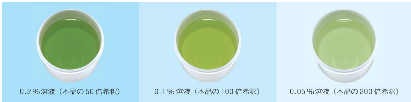
0.2% 溶液（本品の 50 倍希釈）